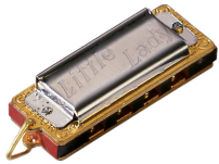
Die „Little Lady“

gebracht. Die Firma Hohner erlebte damals ihre besten Jahre und kooperierte mit Hollywoods Filmwelt.